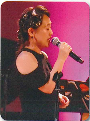
Nandee 〈やびき あきこ〉 ボーカル

仙台市出身。7歳よりクラシックピアノを始め、パイプオルガン、作曲を学び、16歳でヤマハ・エレクトーン・コンクールに優勝。その後、世界各地を演奏旅行し、帰国後、プロのピアニストとして活動を始める。1975年「モントルー・ジャズ・フェスティバル」に出演。1980年以降、オリジナルアルバムを次々と発表。「菊池ひみこバンド」で海外を含む各地のジャズ・フェスティバルやライブハウス等での演奏活動も展開。また、数々のCM音楽やTV音楽、映画音楽など、作、編曲家としての仕事も多数。2019年には自己のグループで、「デトロイト・ジャズフェスティバル」(DJF)に出演。2022年にも、デトロイトジャズオールスターズと共に再度DJFに出演。それに先駆け、ニューヨーク公演も行った。